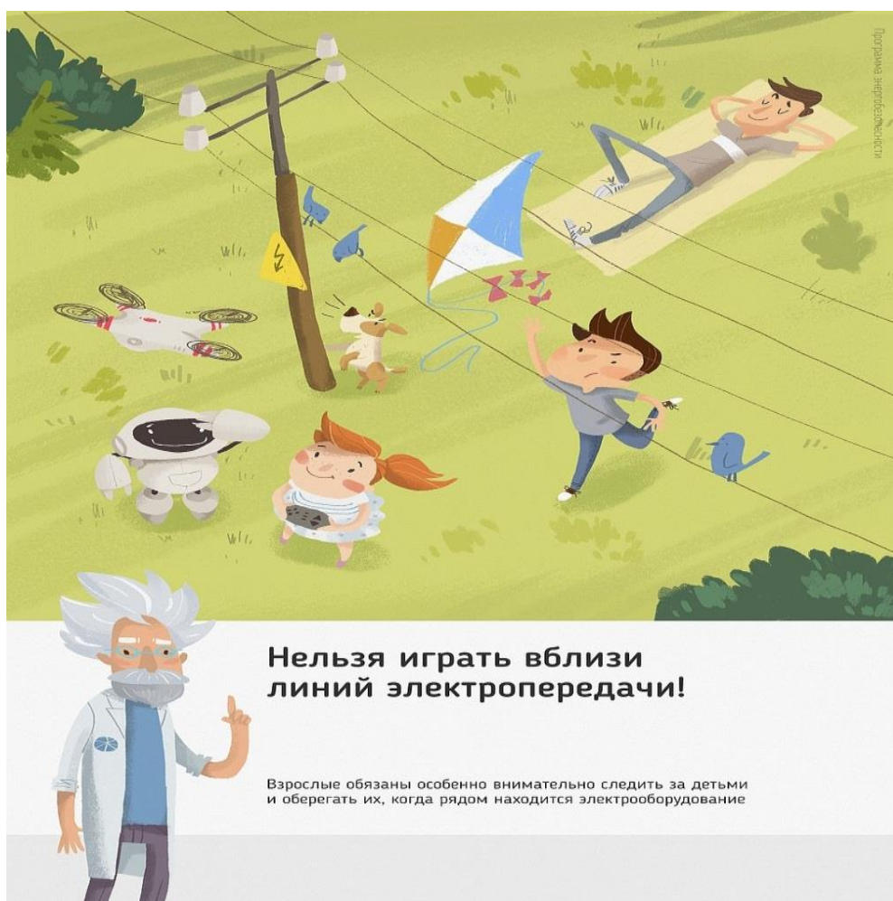
Рис.3 Нельзя играть вблизи линий электропередачи