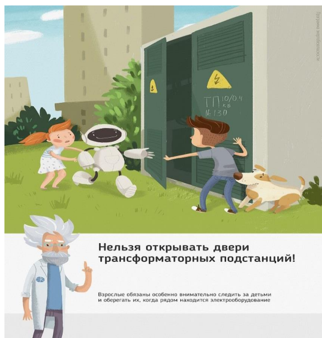
Рис.1 Нельзя открывать двери трансформаторных подстанций

Ежегодно энергетики проводят для школьников познавательные уроки, конкурсы рисунков и историй на тему электричества и правильного с ним обращения. Но работы одних энергетиков в данном направлении недостаточно, для полного понимания проблем электробезопасности нужен пример общества, в котором растет ребенок, и, конечно же, главным образом родителей. Эта работа приносит свои результаты: электротравмы на энергетических объектах единичные, и каждый случай становится поводом для служебной проверки. Но только технических мер мало для того, чтобы полностью обезопасить детей. Им нужен пример родителей.