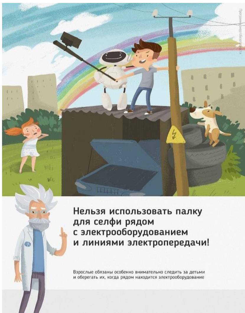
Рис 2. Нельзя использовать палку для селфи рядом с электрооборудованием и линиями электропередачи

Ну и, наконец, нужно повторить с ребенком алгоритм действий в экстремальной ситуации. Проверьте, умеет ли он набирать на сотовом телефоне телефон экстренных служб. Изучите с ним вещества и предметы, которые хорошо проводят электрический ток и потому особенно опасны, и, наоборот, вещества и предметы, плохо проводящие электрический ток и полезные в экстремальной ситуации.